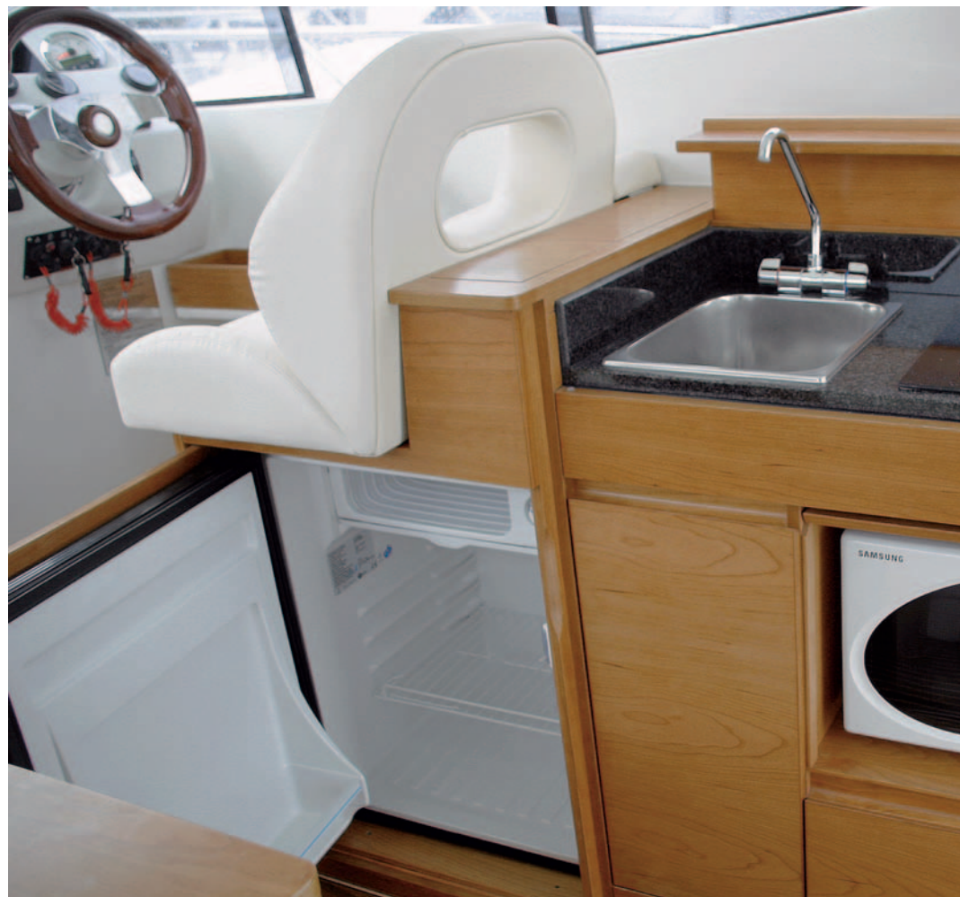
Se ha conseguido una cocina muy aprovechada en un diseño compacto.