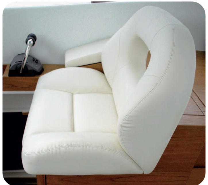
El asiento del piloto se sitúa en la parte superior de la nevera.