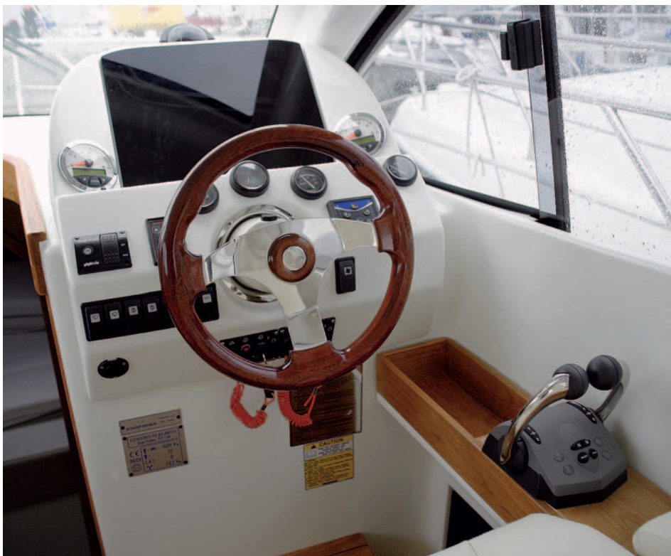
El frontal de la consola es demasiado alto y deja espacio para una gran pantalla electrónica.

ciones, recientemente ampliadas, con laminado manual de casco y cubierta en moldes independientes y mobiliario en madera, que facilitan un total control de calidad en todos sus procesos.