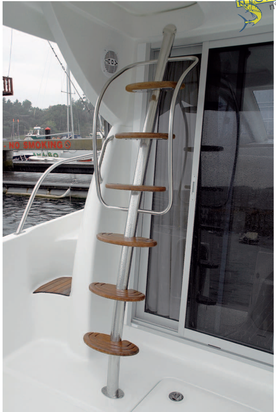
La original escalera incluye unos pasamanos en la parte alta.

Los pasillos que rodean la cabina son cómodos y se complementan con el perfil superior de la estructura, que actúa de pasamanos. En la proa se forma una superficie sobre la que se puede montar un segundo solárium, junto al cofre de fondeo y el molinete, que se encuentra alineado con la roldana situada en el botalón.