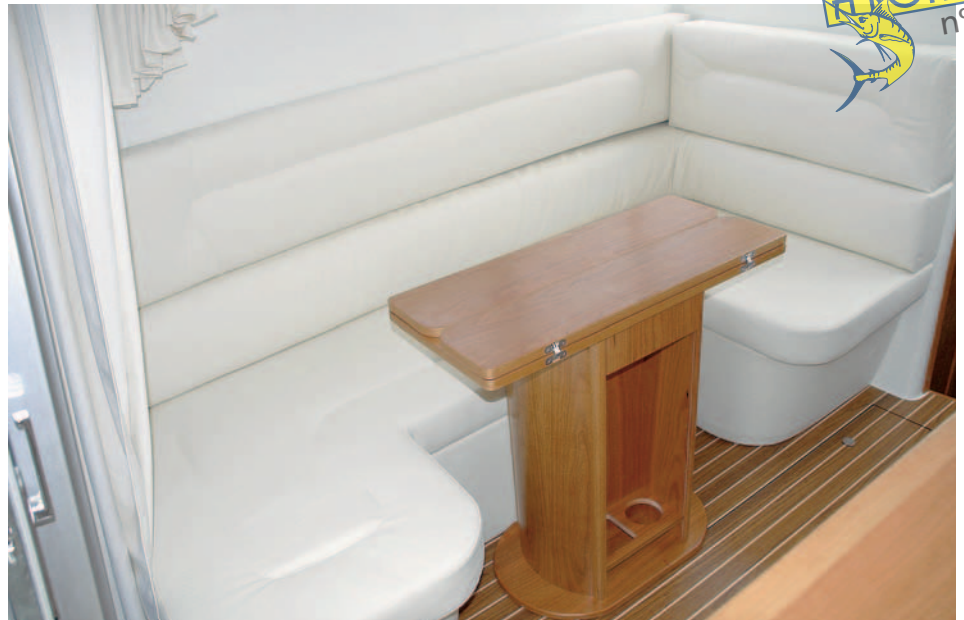
La mesa del comedor es móvil y no cuenta con fijación.

En el apartado técnico, habrá que esperar a probar los nuevos timones que se van a instalar en la serie posterior, que proporcionarán una mejor respuesta en los giros.