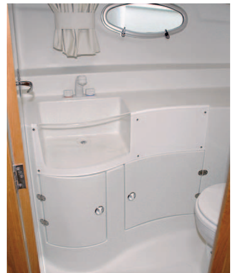
Una de las versiones mostradas del aseo presenta un original lavamanos.