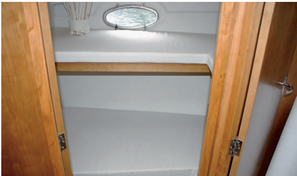
Las literas de babor son de mayor tamaño de lo esperado.

talles, a la posición de los escapes bajo el agua, aunque lo más importante a destacar es que los timones que llevaba la unidad que probamos van a ser sustituidos por unos mayores, que permitirán obtener una mejor respuesta en los giros y a la hora de maniobrar. ► R. Masabeu