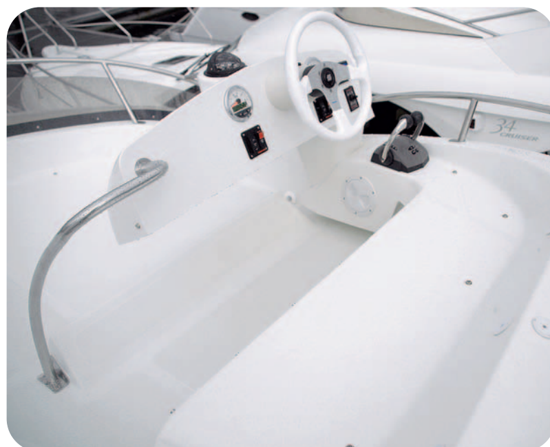
Resulta llamativa la posición del asiento sobre el arco del radar.