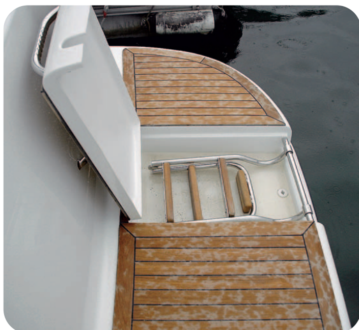
Una tapa oculta la escalera plegable de la plataforma de baño.