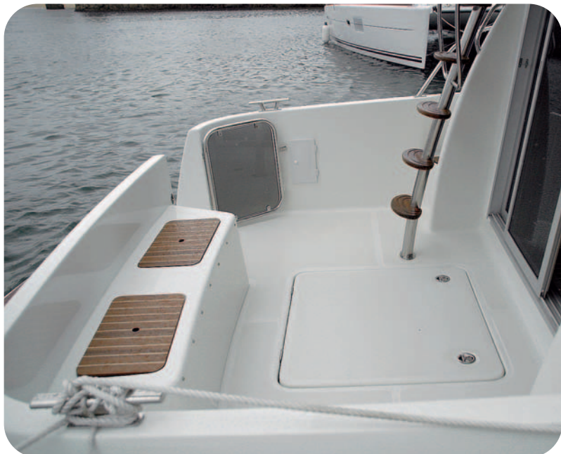
En la bañera dispone de un largo asiento en popa con estiba interior.