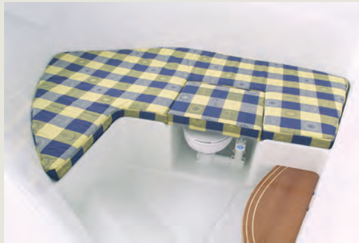
Cama lateral con asiento vestidor - Double berth to starboard with vanity seat in forward cabin

The concept of this attractive and economical fishing-cruiser is characteristic of that normally associated with larger boats.