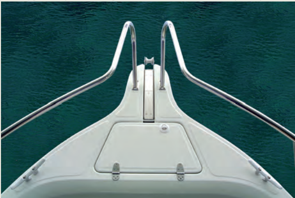
Botalón con roldana y herraje inox de protección - Bow platform with S/S sternhead fitting.