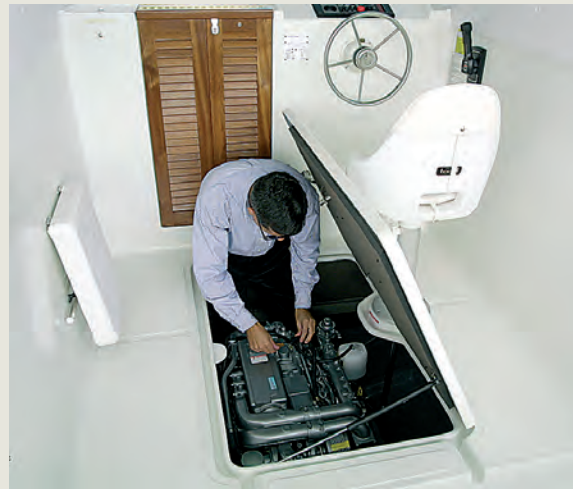
Cámara de máquinas de fácil acceso - Easy access to engine compartment.