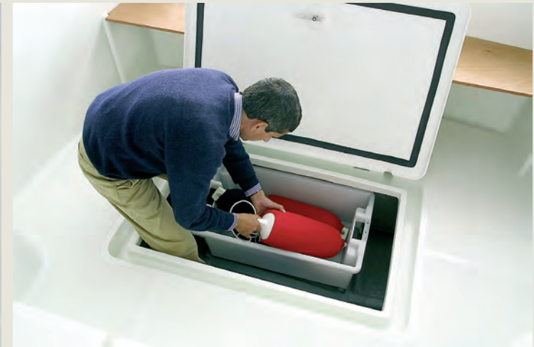
Amplio cofre central de estiba - Large central lazarette hatch.