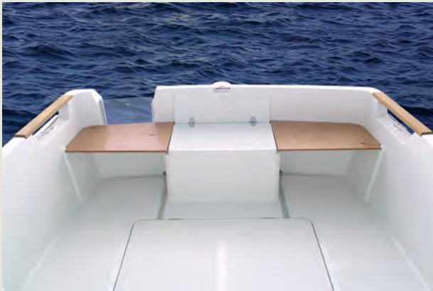
Vista de la bañera enrasada con cofres y asientos - View of the cockpit with lockers and seats