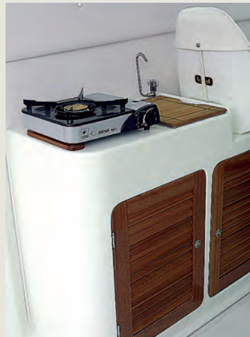
Bloque cocina opcional - Optional galley unit.