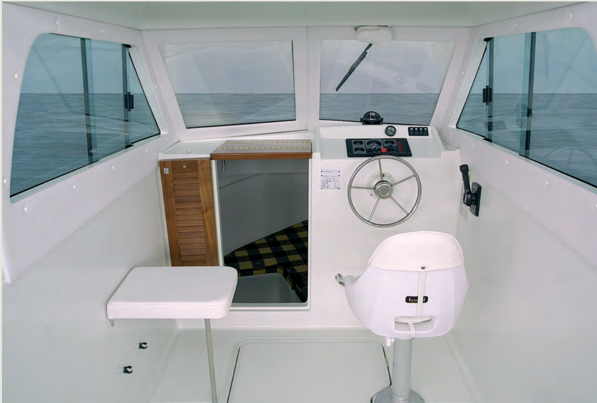
Cabina y puesto de gobierno con capó motor enrasado - Wheelhouse with integrated engine hatch.