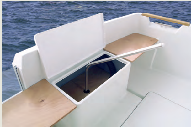
Caña de emergencia adaptable para la pesca al curricán - Emergency tiller adaptable as trolling tiller