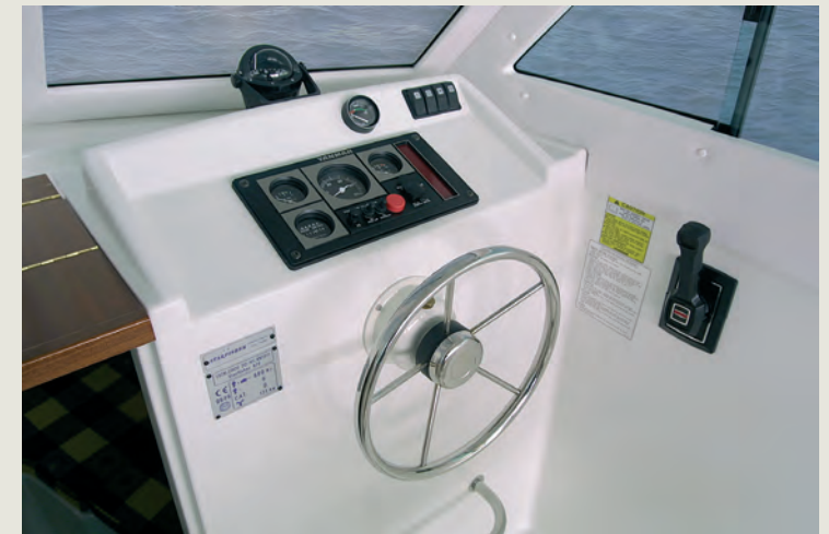
Consola con espacio que permite instalar electrónica empuñable - Large console for electronics.

Born of a new generation, the ST 670 is designed for comfortable sport fishing, offering the spaciousness of a bigger boat.