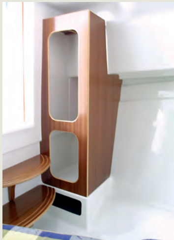
Armario perchero - Hanging locker.