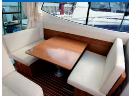
Drei in eins: Von der Dinette zum Co-Pilotensitz zur Kojе. Die Umbaumöglichkeiten im Salon sind unkompliziert und pfiffig.

Nicht ganz optimal waren die Arretierungen des Beifahrersitzes und die der achteren Schiebetür, die sich während der Fahrt in kurzer Welle lösten. Das Problem wurde von