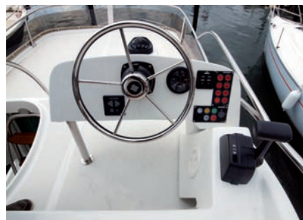
Doppelte Kommandozentrale: Der Fahrer hat innen und außen volle Kontrolle.

Motorraum -Löschanlage gehört zur Standardausstattung.