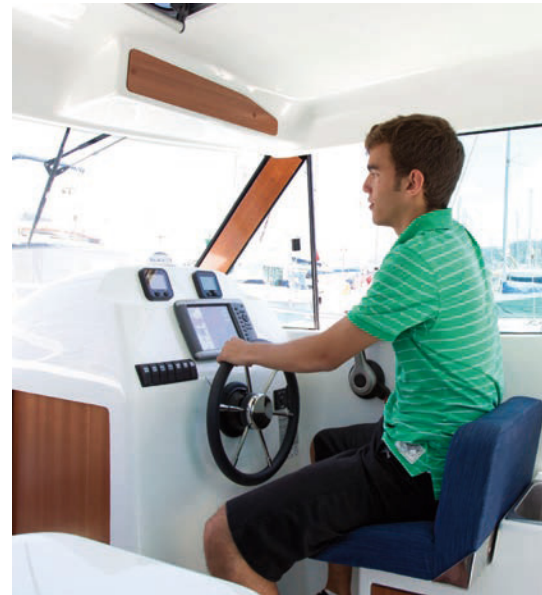
El puesto de gobierno, a estribor, dispone de un cómodo asiento de pilotaje abatible. A comfortable foldable helm seat is located on starboard.