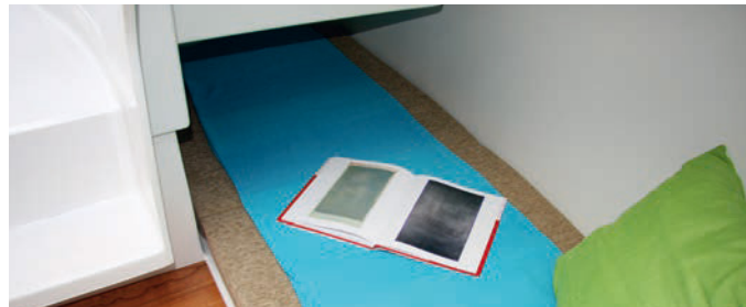
Amplia cama de babor (2,10 m x 0,85 m), ideal también como espacio de estiba. Large port-side bed (2,10 m x 0,85 m), also an ideal storage place.