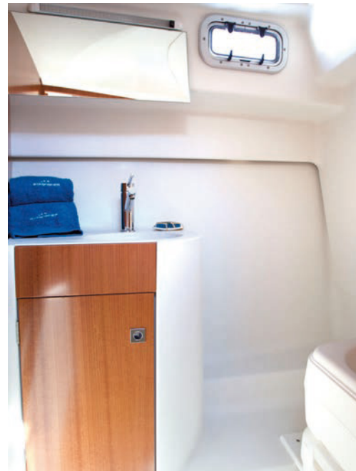
A estribor dispone de un aseo separado de 1,75 m de altura. On starboard there is a separate head 1.75 m in height.