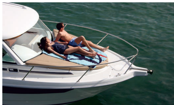
Espaciosa proa, con pozo de anclas y solarium de proa acolchado (1.80 m x 1.70 m). Spacious bow, with wide anchor locker and large mattress sunbed (1.80 m x 1.70 m).