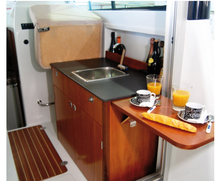
Mueble de cocina completo con fregadero profundo y mesa plegable. Fully equipped galley, with deep sink and expanding table for extra preparation space.