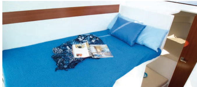
Posibilidad de pernocta de hasta 4 personas, gracias a la dinette transformable en cama. 4 sleeping places, thanks to a transformable dinette.