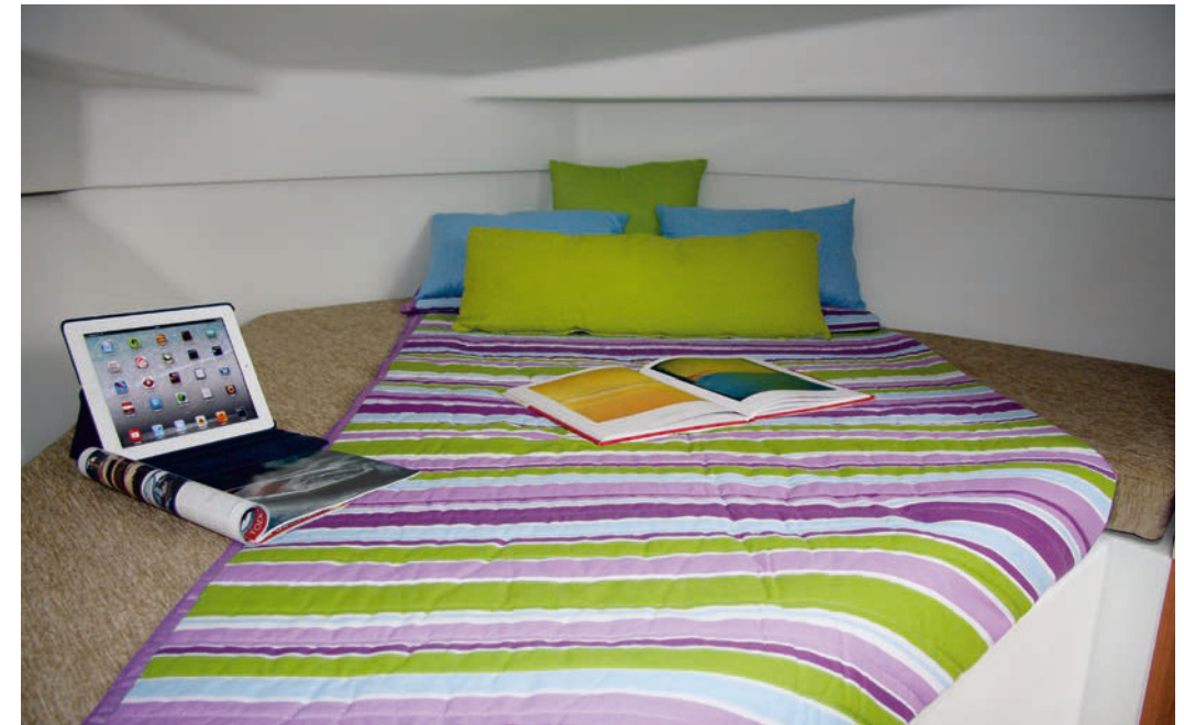
Espacioso camarote de proa con cama doble (2,00 m x 1,35 m). Roomy front cabin with large double berth (2.00 m x 1.35 m).