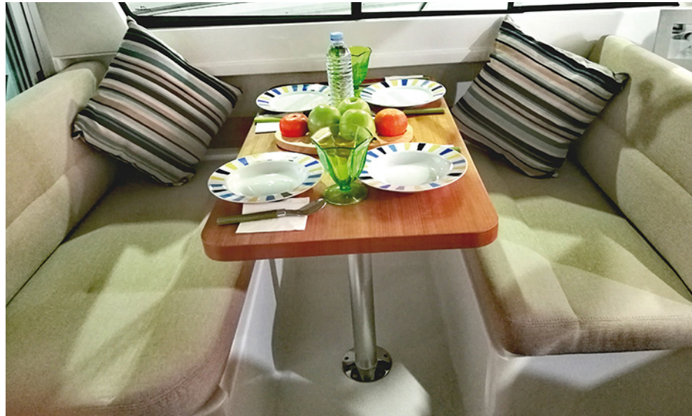
La dinette permite acomodar a 4 personas confortablemente. Sus amplias ventanas laterales (correderas) proporcionan una total ventilación. The dinette accommodates 4 people comfortably. Its extensive lateral windows provides full ventilation.