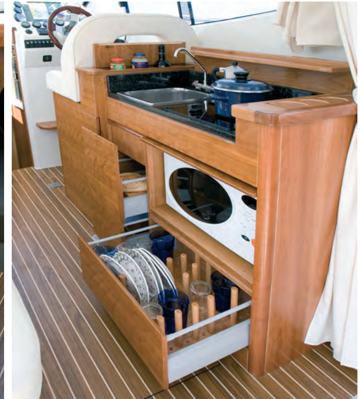
Mueble cocina en madera maciza que se distingue por su diseño y capacidad; incluye microondas, frigorífico y agua caliente.

Puesto de gobierno a estribor con asiento biplaza.