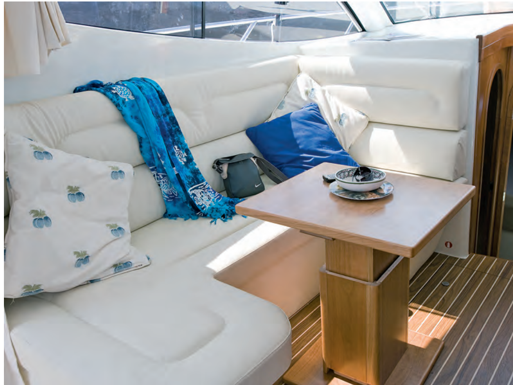
El acogedor salón-dinette permite una cómoda vida a bordo gracias a su confortable sofá en L (convertible) y mesa central. In the saloon, a lounge-dinette converts easily from sofa to an extra bed.