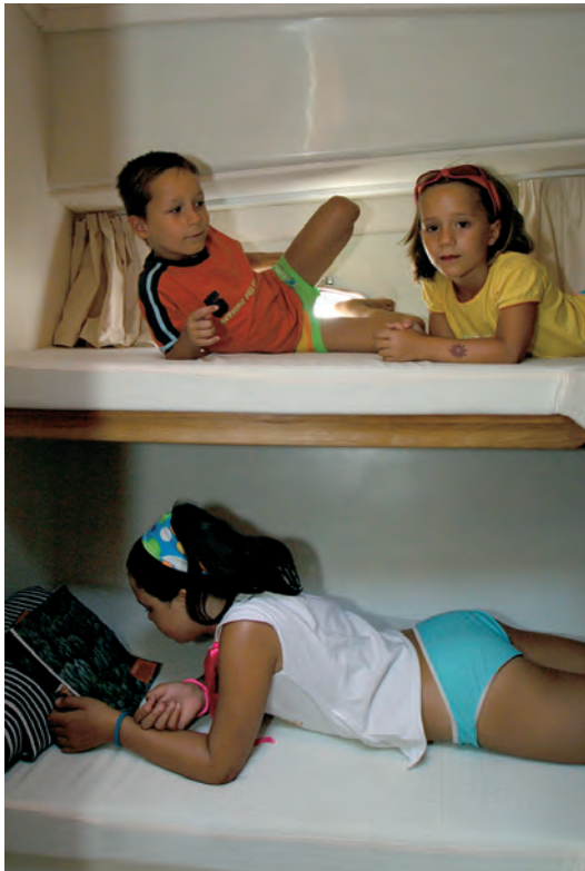
Camarote de invitados a babor con dos amplias literas. The aft cabin, situated on the port side, consists of two bunk beds.

The ST-30 Cruiser has a convenient and comfortable interior adapted to the special needs of a cruiser sailing programme making life on board easy.