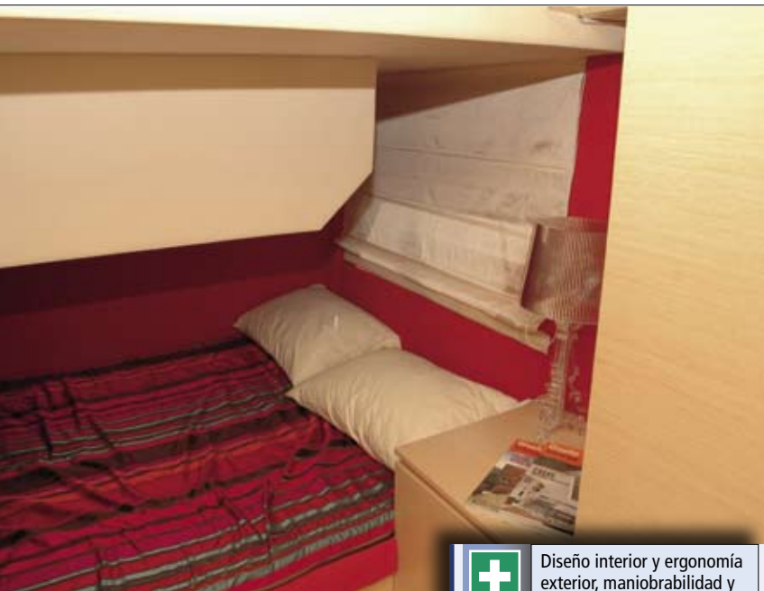
▲ En babor se ubica un camarote con cama doble