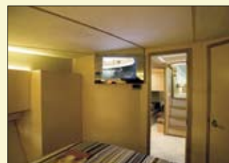
En la cabina del armador se puede instalar opcionalmente una pantalla de TV plana con DVD.