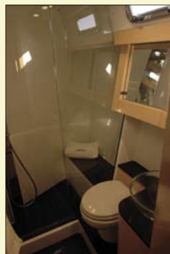
La ST45 cuenta con dos baños, cada uno de ellos con ducha independiente.