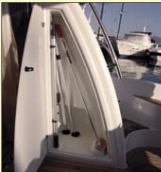
En la bañera y a ambos lados de la estructura de fly se han dispuesto sendos registros verticales y contramoldeados.