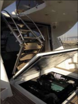
La escalera del fly es en inox y articulada, y está sujeta a la tapa de acceso a los motores.