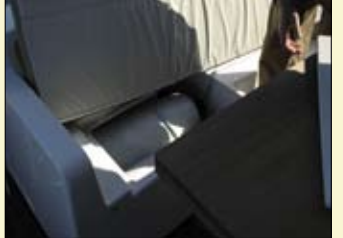
Encontraremos un gran espacio de estiba bajo el asiento transversal de bañera.