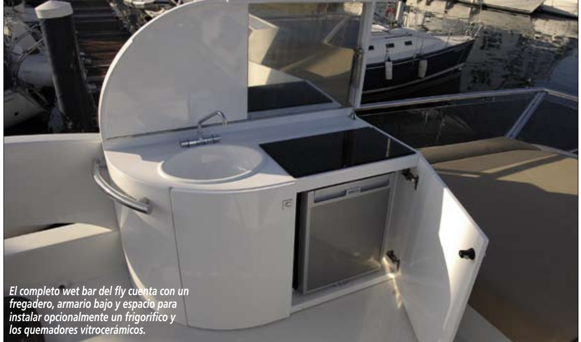
El completo wet bar del fly cuenta con un fregadero, armario bajo y espacio para instalar opcionalmente un frigorífico y los quemadores vitrocerámicos.

fly es cómodo e incluye un doble asiento con respaldo de rulo abatible. Sin embargo, a altas velocidades, echamos en falta algún tipo de visera o protector para viento en la parte delantera de la consola de gobierno.