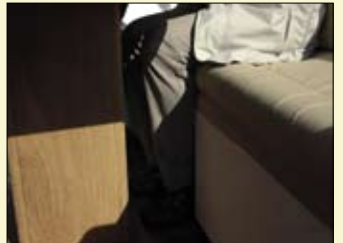
El asiento de la bañera cuenta con un encaje central para facilitar el asiento cuando ajustamos la mesa hacia popa.