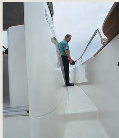
Pasillo walk-around. Close up of walk around gangway.