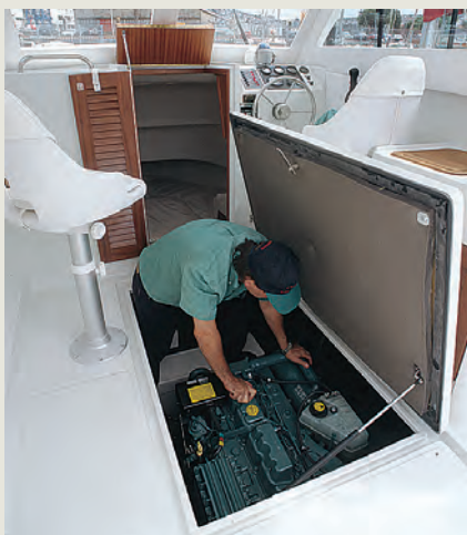
Cámara de máquinas de fácil acceso. Close up of easy access to engine compartment.