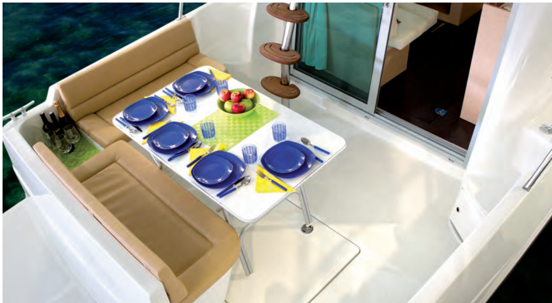
La bañera, supera ampliamente las dimensiones habituales en su eslora, admite la ubicación opcional de asientos para la práctica de la pesca deportiva. La bañera mantiene el tradicional espejo de popa, con puerta lateral para salvaguarda de los tripulantes especialmente niños y personas mayores. Destaca la gran superficie de la plataforma de popa para la práctica del baño y el buceo con escalera escamoteable. A spacious cockpit exceeds the usual dimensions of boats with similar length and allows the optional installation of comfortable seats making it easier to practise game fishing. In the cockpit the lateral door increases the safety of the crew especially for children and older people. A big bathing platform with integrated ladder is ideal for diving or swimming.