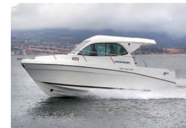
versión Hard Top