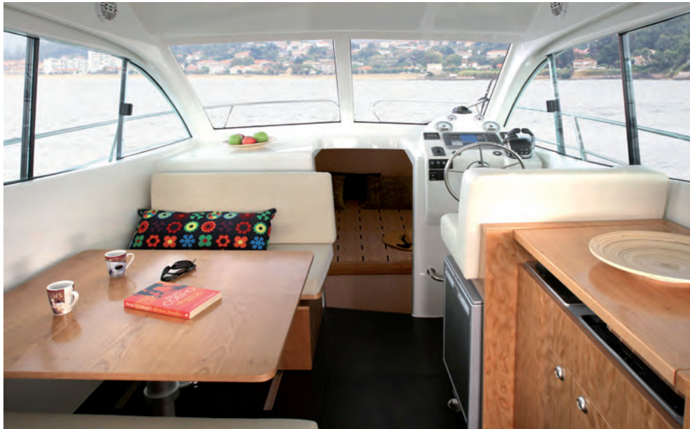
La habitación de cabina, confortable y luminosa, incluye puesto de gobierno, dinette y mueble de cocina. The quality solid wood furniture finishing contribute to a comfortable and warm interior.