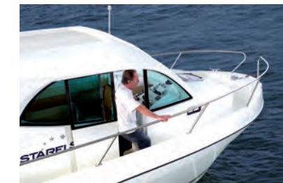
Puerta lateral opcional versión Walk Around Walk Around version with optional sliding door