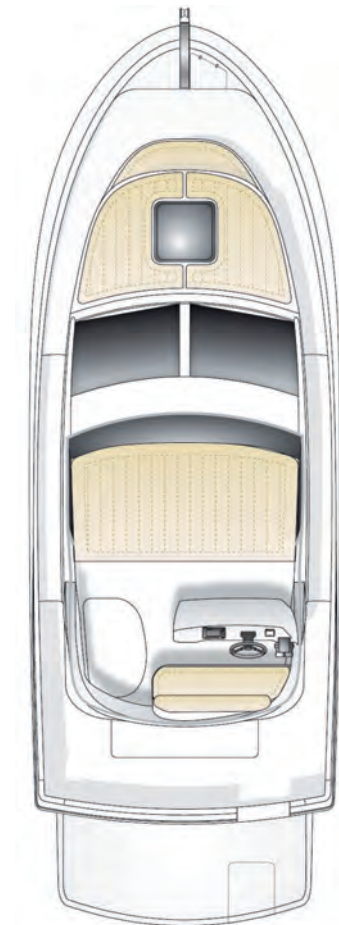
Versión Fly Walk Around