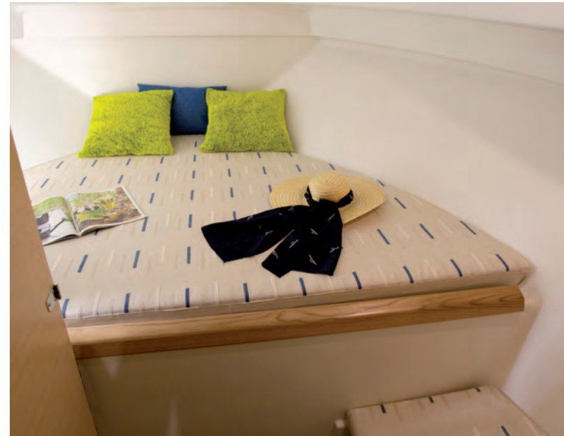
El compacto interior del camarote de proa dispone de cama doble Br/Er, aseo completo independiente y armario ropero. The compact interior of the forward cabin provides a double bed, separate head and locker.