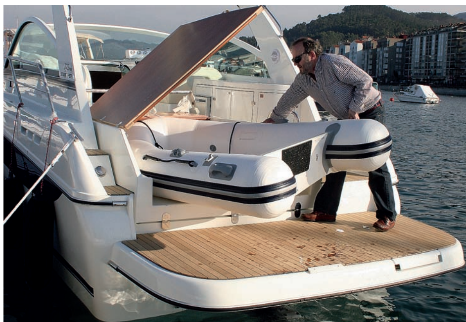
Una sola persona puede botar y estibar la neumática auxiliar.