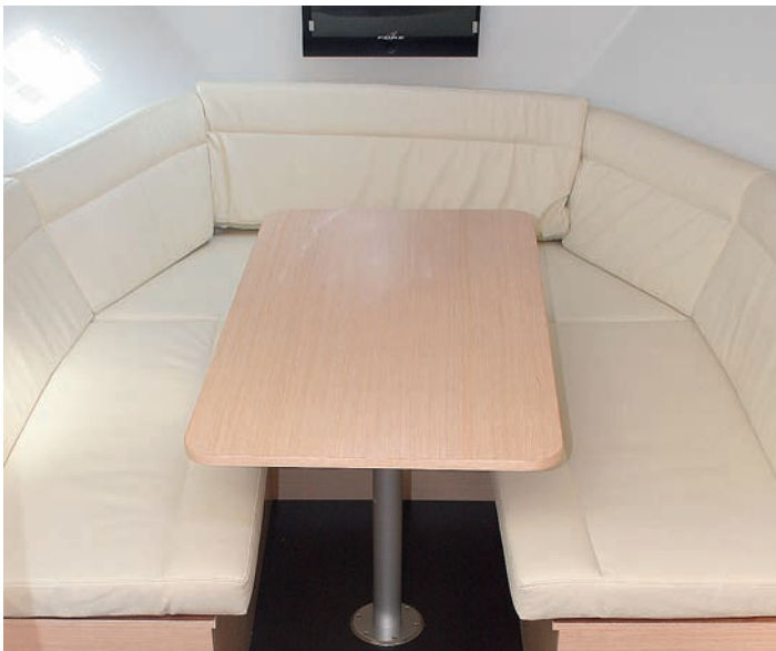
El salón es convertible en cama doble.