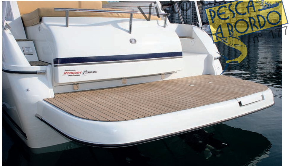
El barco Cancún 290 luce el distintivo de "Installation Quality".

de televisión y bajo los asientos del sofá hay amplios cajones para la estiba en los interiores. En la banda de babor, se ha instalado un armario con una nevera y un horno microondas, y en el lado opuesto, otro con el panel eléctrico, estantes y cajones varios. A continuación de éste, en una estancia separada hay un aseo con inodoro, lavabo y ducha.