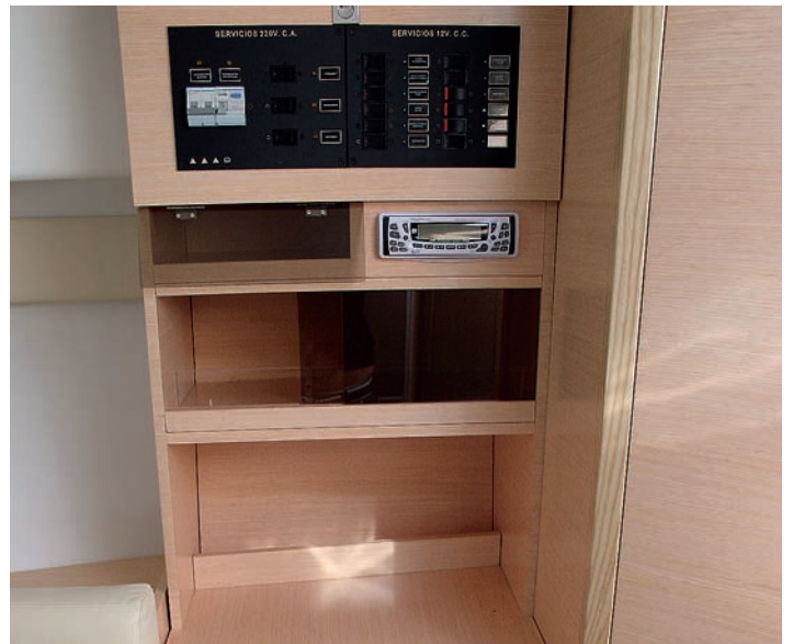
Abundante espacio de almacenaje.