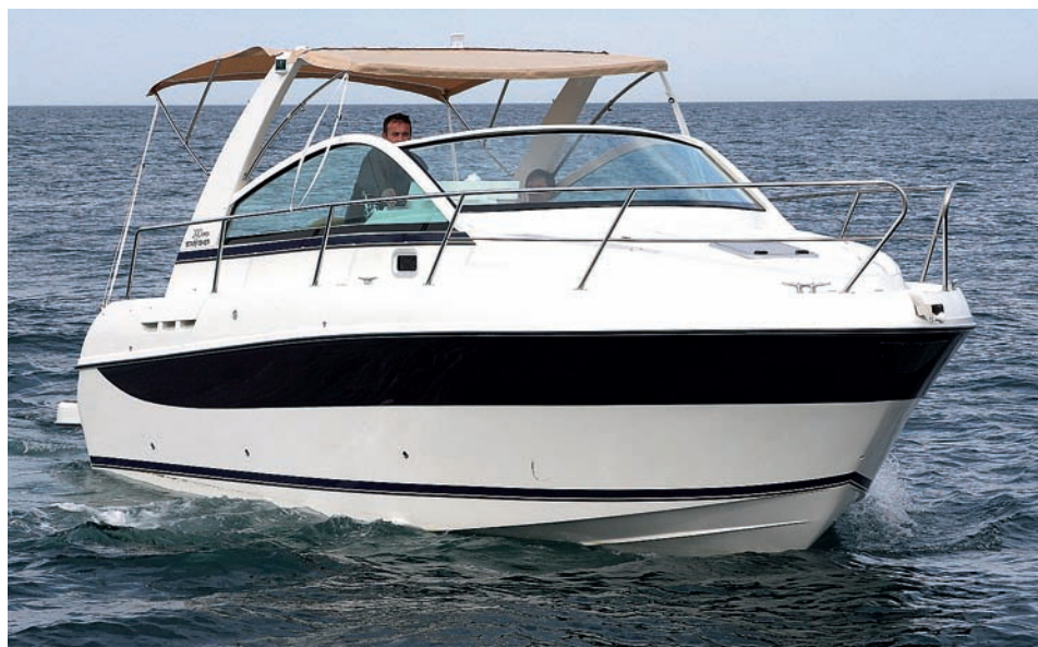
Un toldo de lona cubre toda la bañera, desde el puesto de mandos hasta el solárium.

Por otro lado, al ser su eslora de homologación 7,99 metros queda exenta del pago de impuestos de matriculación. Un ocho metros con numerosas ventajas.