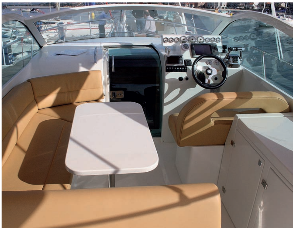
La bañera de esta unidad se compone de una cómoda dinette y un mueble auxiliar con cocina.

En Baiona, participamos en la presentación de este nuevo modelo, el Starfisher Cancún 290, cuya buena acogida por parte de los aficionados ha propiciado que ya sean una veintena las unidades que se encuentran en el agua.