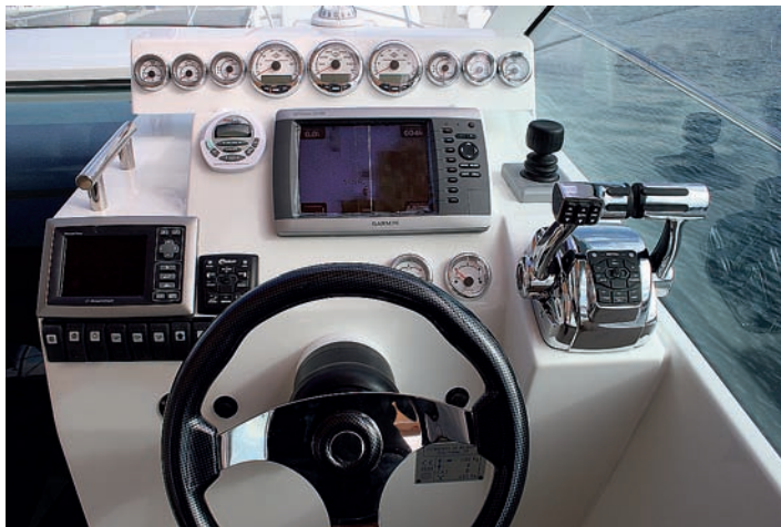
Los mandos y la palanca del motor son fácilmente accesibles.

en parte gracias a la amplitud de la plataforma de baño, que nos permite un gran radio de acción.